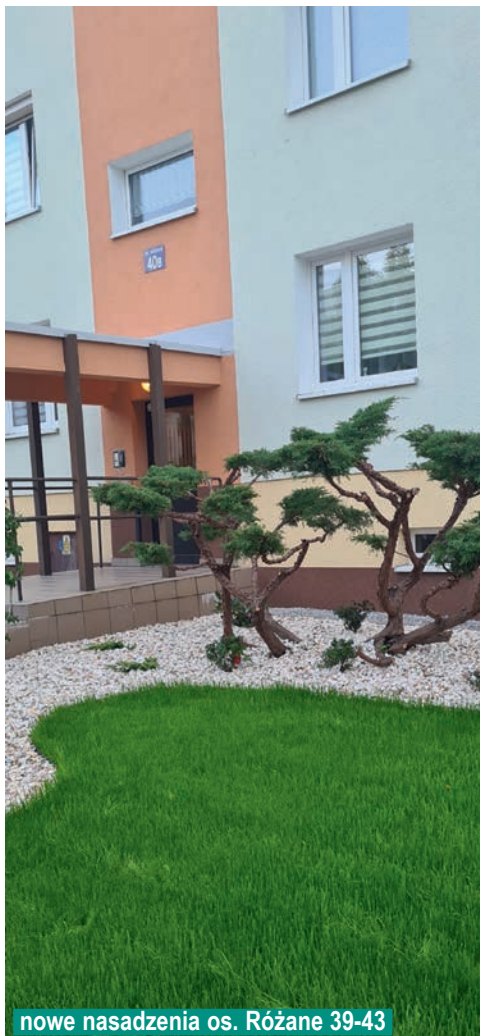
nowe nasadzenia os. Różane 39-43

Jeśli mieszkańcy chcieliby, aby na ich terenie dokonano nowych nasadzeń, zachęcamy do kontaktu ze Spółdzielnią Mieszkaniową i złożenia odpowiedniego podania.