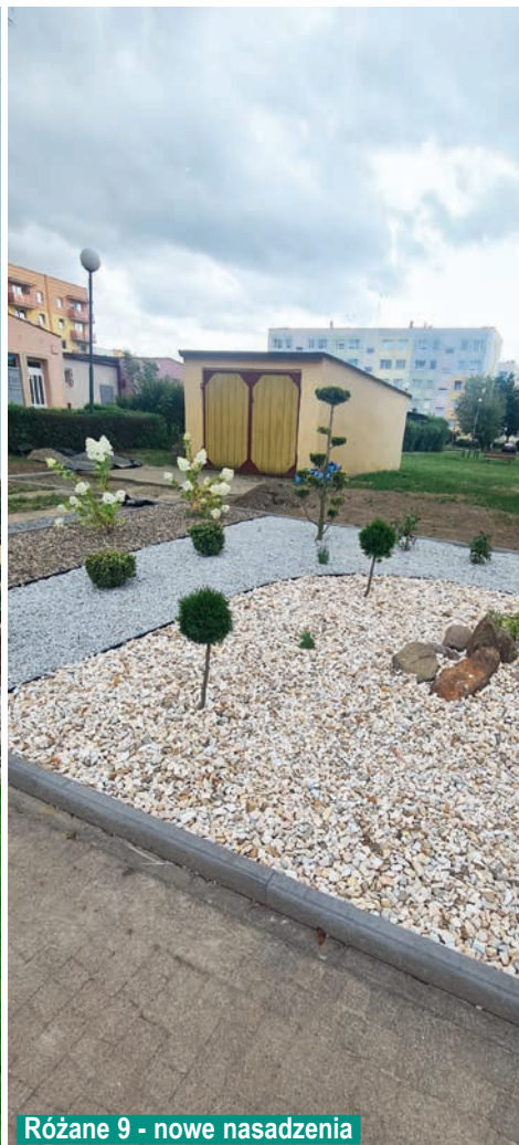
Różane 9 - nowe nasadzenia