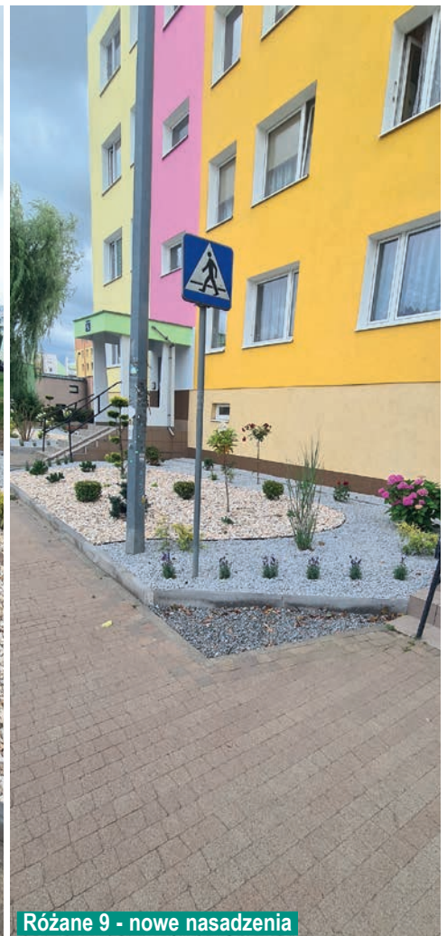
Różane 9 - nowe nasadzenia