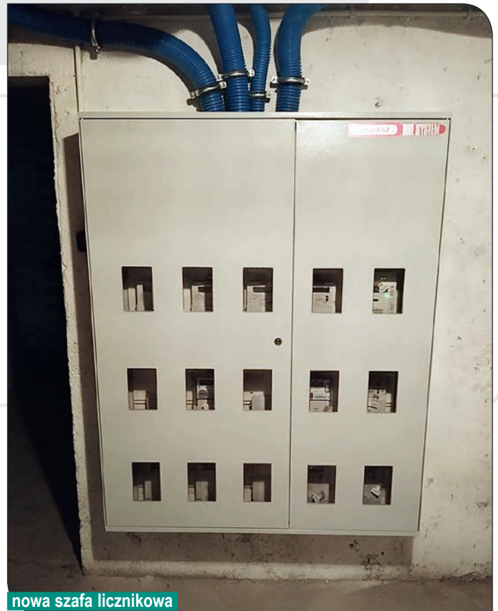
nowa szafa licznikowa

W Piławie Górnej, w budynkach ul. Staszica 38-42 i 44-48 rozpoczęliśmy wymianę pionów instalacji gazowej.