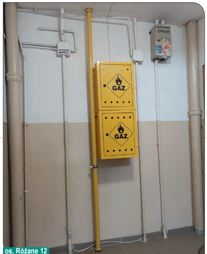
os. Różane 12